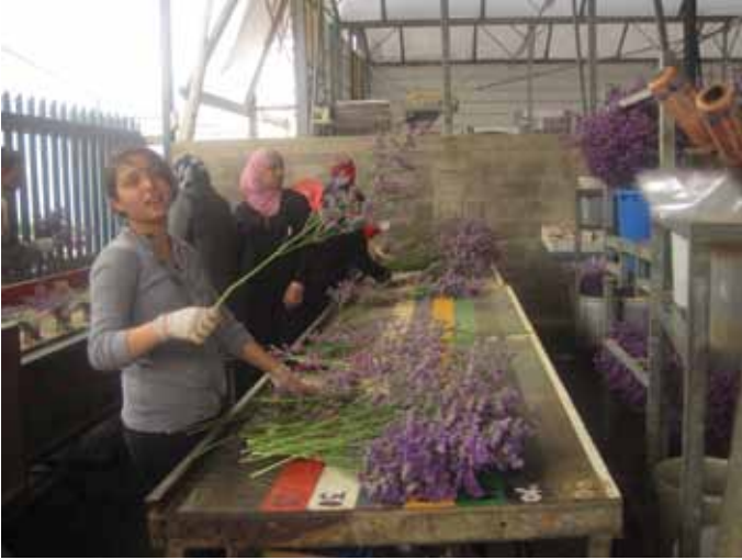
عاملات في مزرعة باسكال بمنطقة عولش، ايار ٢٠١١

بدأت ٧٠ عاملة بالعمل في الزراعة في الأشهر الاخيرة من خلال نقابة العمّال "معاً". منذ خمس سنوات تنشيط نقابة العمّال "معاً" في منطقة المثّث والجليل وتقييم علاقات عمل بتّاعة مع الكثير من المزارعين الذين يستوعبون كل موسم عاملات عضوات في "معاً". وقد انعكس ذلك في استيعاب ٥٤ عاملة من باقة الغربية ووادي عارة والفريديس في مزارع في منطقة الشارون. ٣٠ من ال ٥٤ عاملة انضممن للعاملات الثابتات في مزرعة باسكال ومعمل التعليب چالي موشيه للبطاطا. وهاتين مزرعتين استثنائيتين اذ انهما تشغلان عاملات معا بشكل ثابت منذ نحو خمس سنوات. في مزارع اخرى بمنطقة الشمال لجحت معا في تشغيل ١٦ عاملة بعضهم من كفر مندا. وبعضهن من طمرة بالتعاون مع مركز الاستثمار البشري طمرة كابول.